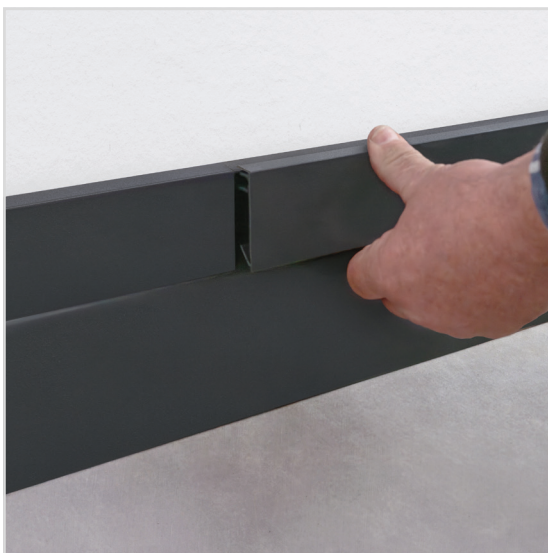
Anwendung Trittschutz - Abdeckprofil