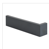
Laibungsecke Abdeckprofil links

PROSTEP ist das clevere, mehrteilige Trittschutzsystem für optisch ansprechende Wandanschlüsse. Mit passgenauen Verbindern, Kopfstücken, Ecken und Laibungsprofilen bekommst Du maximale Flexibilität bei der Montage und ein durchgängiges, elegantes Design ohne sichtbare Befestigungen. Robust, langlebig und einfach montiert.