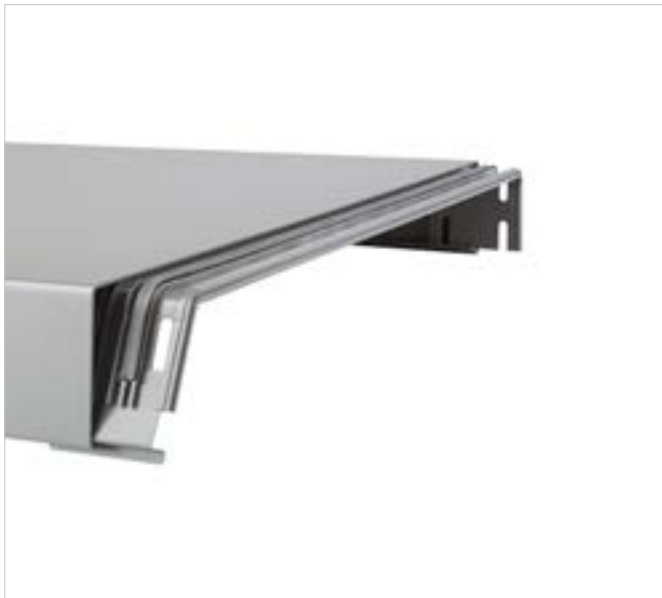
MHA Mauerabdeckung CLIP IT