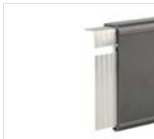
Verbinder im Profil