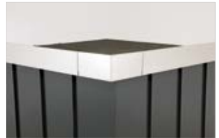
Anwendung von Ventox